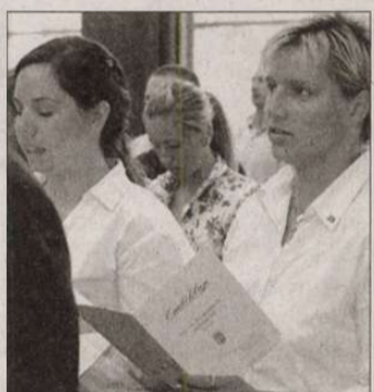
Esküt tettek a sportolók