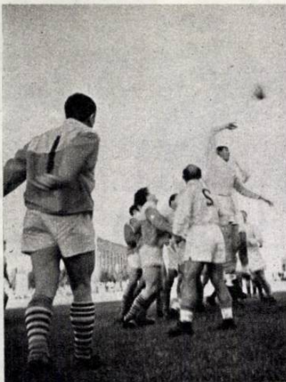
A boly – madártávlatból...