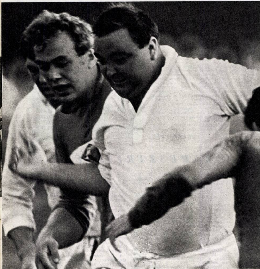
Amikor a labda gyorsabb...