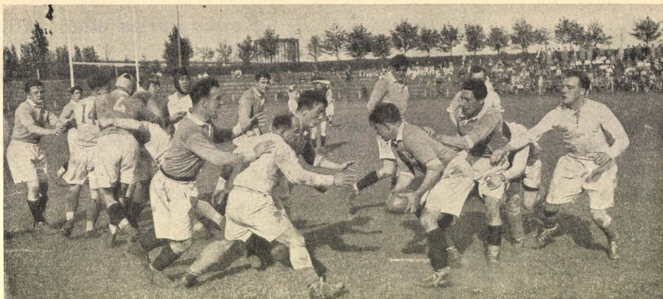
Rugby. A meccs elején